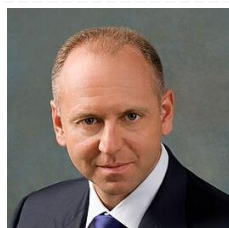
Дмитрий Пумпянский президент

В ходе первой испытательной поездки поезд весом 1644 тонны из 18 двухэтажных вагонов и электровоза ЧС6, имитирующего вес пассажиров, преодолел путь между Москвой и Санкт-Петербургом чуть более чем за 4,5 часа. В составе поезда два электровоза – ведущий ЭП2К-168 и ведомый ЭП2К-500. Испытания проводятся на главном ходу линии Москва – Санкт-Петербург. Их цель – установление критической нормы массы поезда, определение времени хода. Подробнее